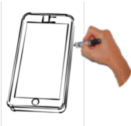
Croquis d'un smartphone en 3D